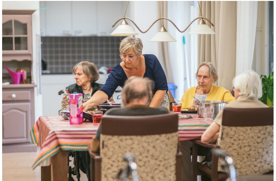
Nieuwe Regionale Zorgacademie van start: leer- en loopbaan ineen.

Nieuwe Regionale Zorgacademie van start: 'Voor herintreders en carrièreswitchers met of zonder ervaring in de zorg'; tien organisaties slaan handen ineen en bieden deelnemers een betaalde leer- én loopbaan